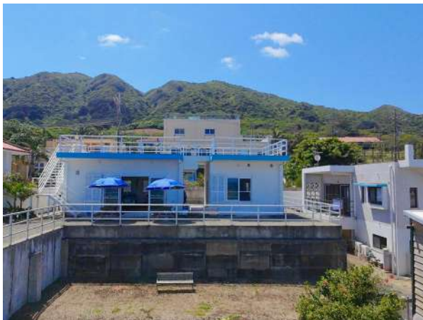
レストランと店舗