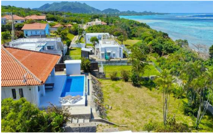
上空写真（東から撮影）