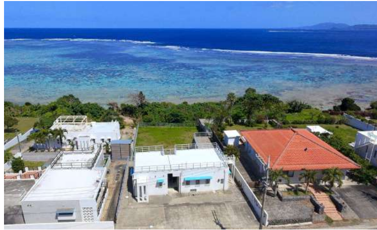
上空写真（南から撮影）