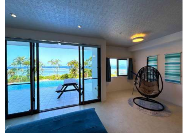
リビング・テラス