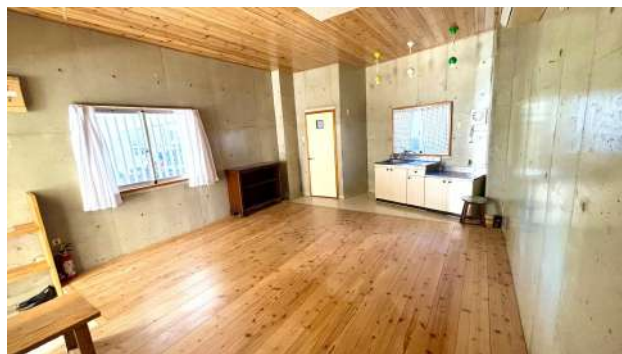
1Fのワンルーム（事務所）