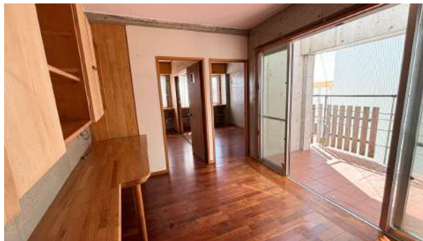
3F 子供部屋前プレイルーム