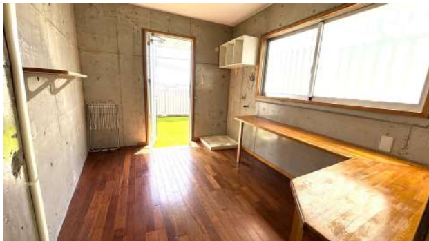
4F 洗濯スペース約 6帖