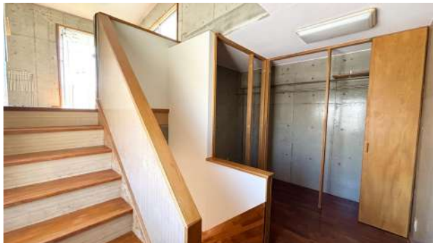
3F 洗面所前ファミリークローゼット