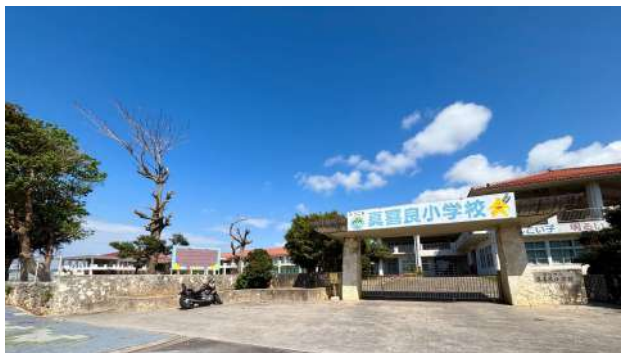
真喜良小学校 350m (徒歩 5分)