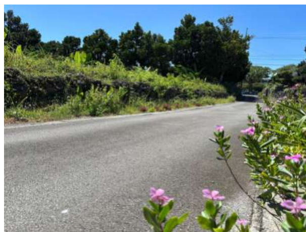
北東公道（幅員 4m以下）