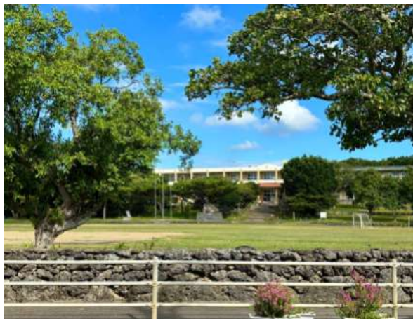
白保小学校 37m (徒歩 1分)