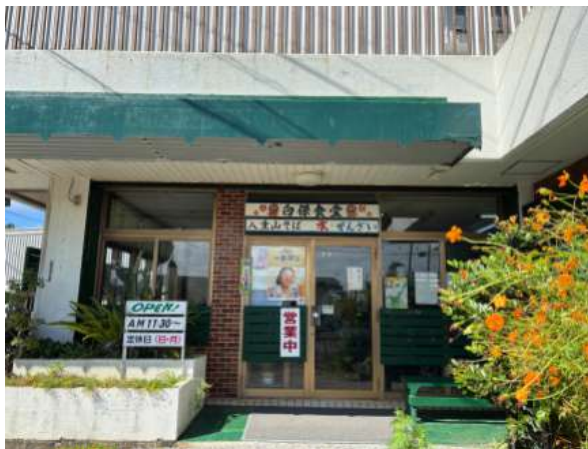
白保食堂 200m (徒歩 3分)