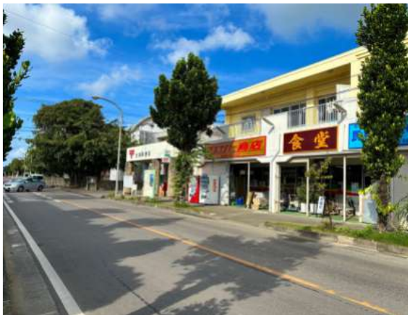
白保郵便局 100m (徒歩 2分)