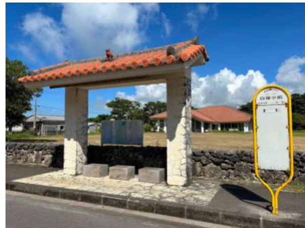
白保小学校前バス停 60m (徒歩 1分)