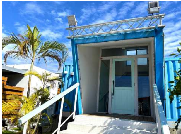
レストランエントランス