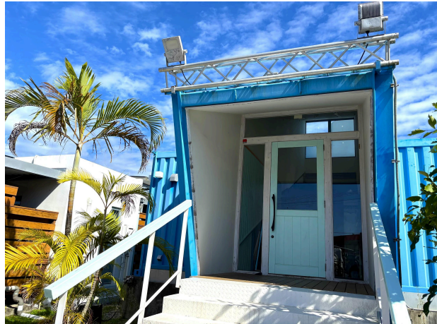
レストランエントランス