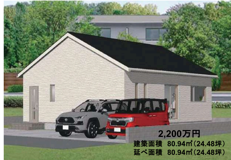
2,200万円 建築面積 80.94㎡ (24.48坪) 延べ面積 80.94㎡ (24.48坪)