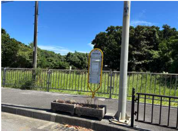
白保中学校前バス停 570m (徒歩 8分)