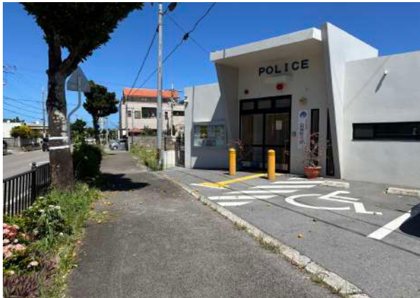
白保警察派出所 280m (徒歩 4分)