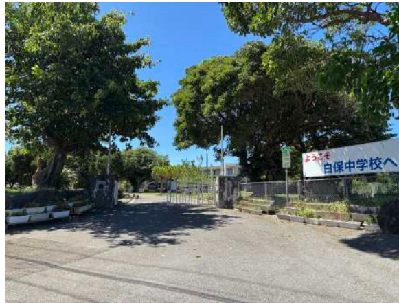
白保中学校 550m (徒歩 7分)