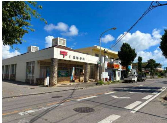
白保郵便局 760m (徒歩 10分)