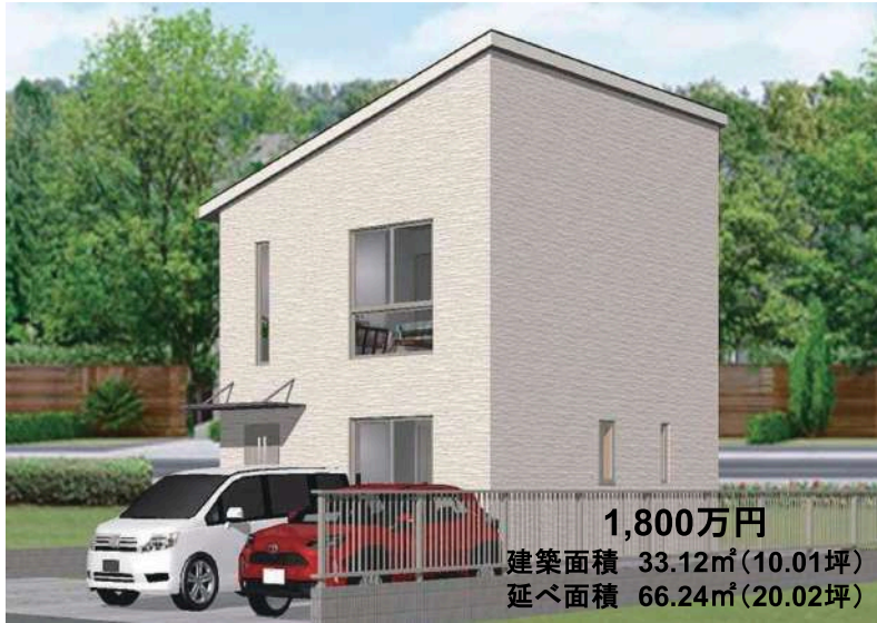
1,800万円 建築面積 33.12㎡ (10.01坪) 延べ面積 66.24㎡ (20.02坪)