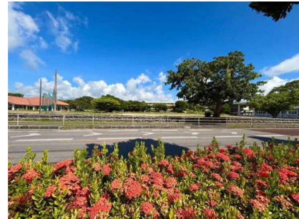
白保小学校 690m (徒歩 9分)