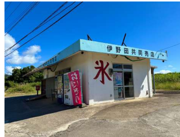
伊野田共同売店 1.8km (車 5分)