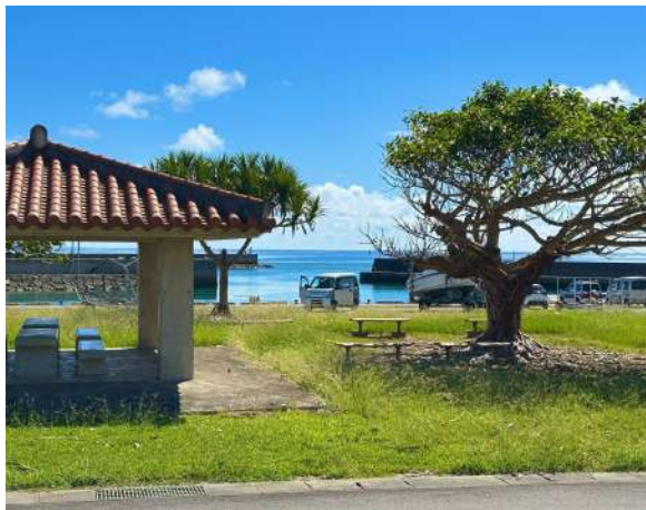
伊野田漁港 1km (車 3分)