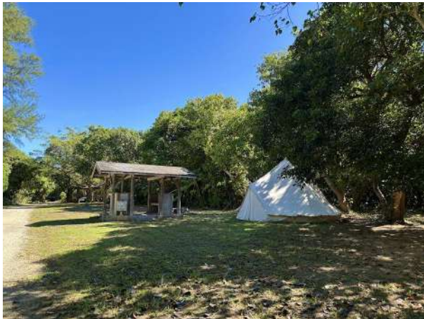
伊野田キャンプ場 2.1km (車 6分)