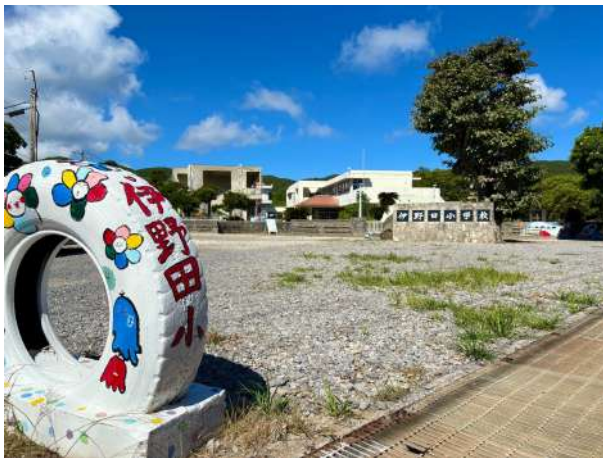
伊野田小学校 340m (徒歩 5分)