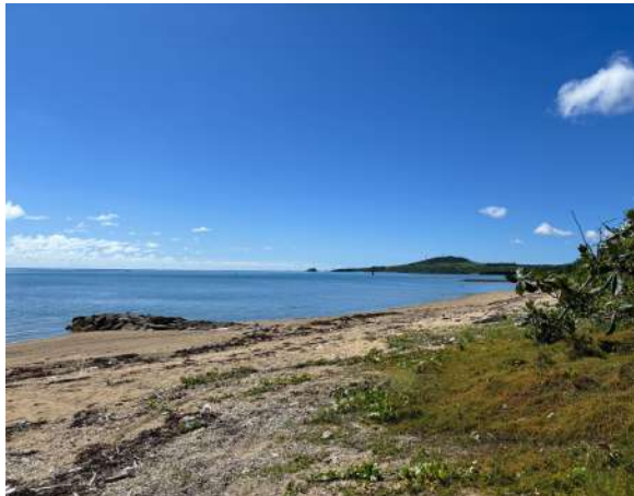
伊野田海岸 2.1km (車 6分)