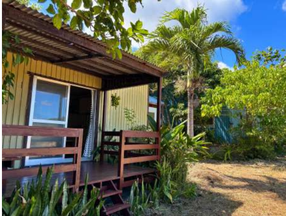
建物ウッドデッキ