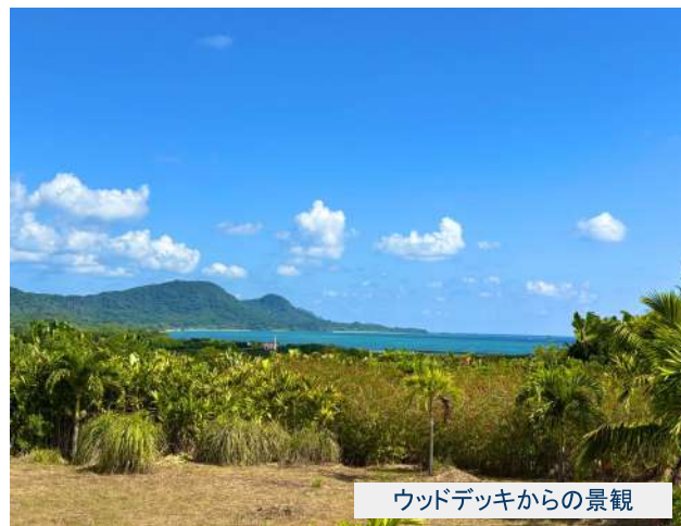
ウッドデッキからの景観