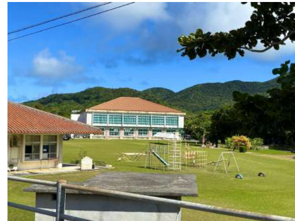
野底小学校 1.2km (徒歩 15分)