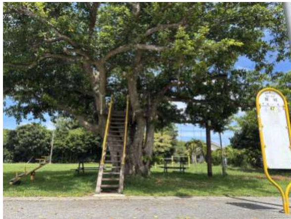
兼城バス停 400m (徒歩 5分)