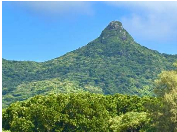
野底マーペー登山口 1.6km (車 4分)