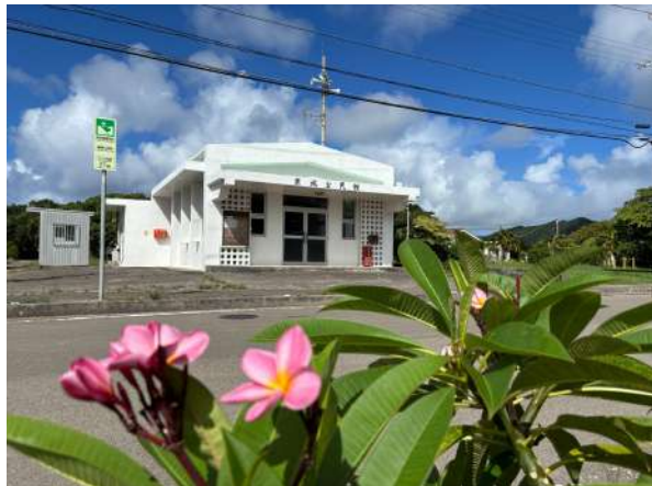
兼城公民館 400m (徒歩 5分)