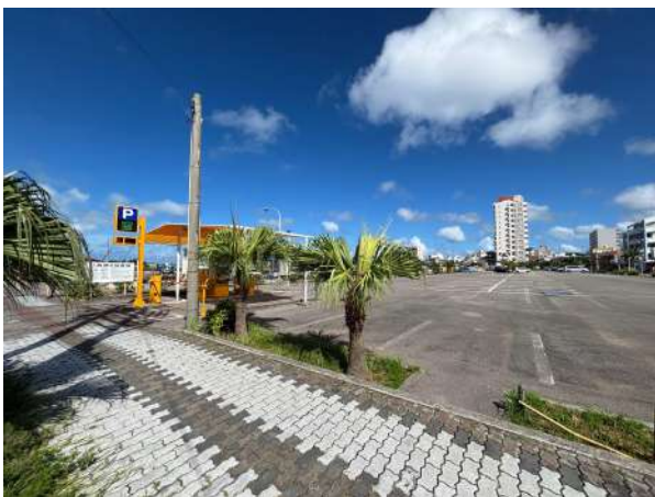
市営駐車場 50m (徒歩 1分)