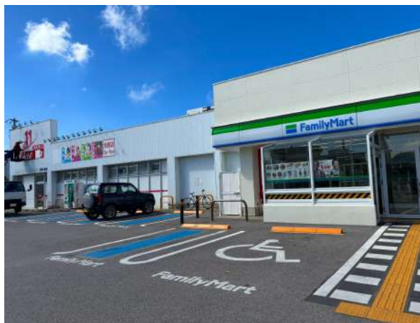
コンビニ・ドラッグストア 50m (徒歩 1分)