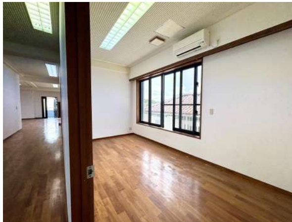
2F 洋室 7.5帖