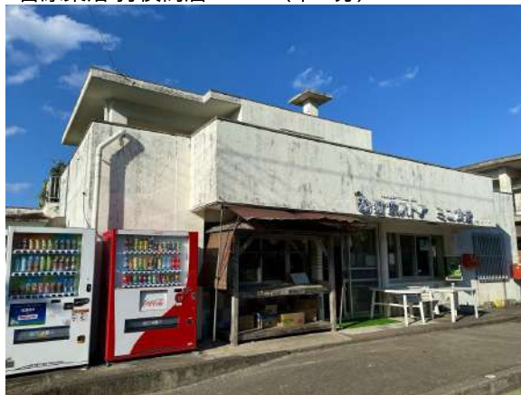
吉原集落 狩俣商店 1.4km (車 2分)