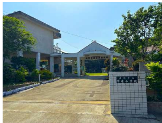
吉原小学校 1.8km (車 3分)