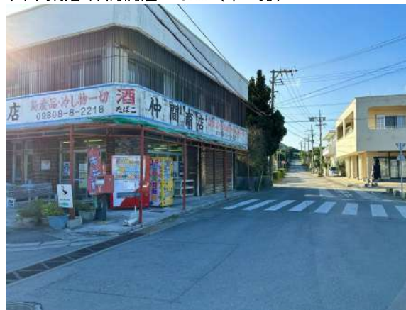
川平集落 仲間商店 2.9km (車 4分)