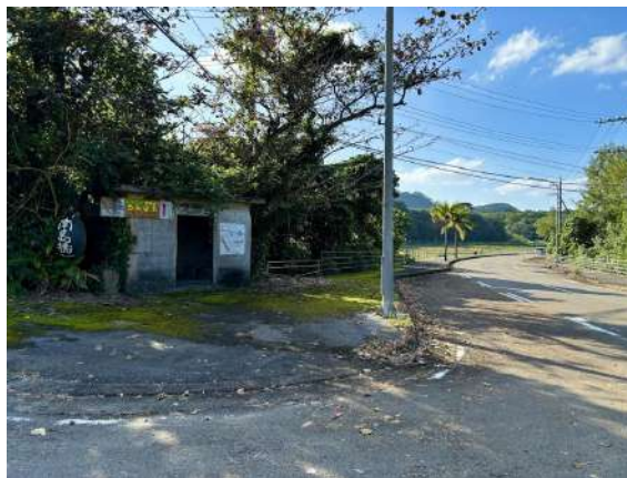
大嵩バス停 210m (徒歩 3分)