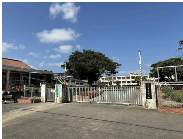
大浜小学校 450m (徒歩 6分)