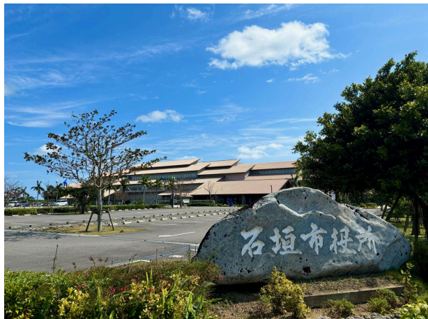
石垣市役所 1.6km (車 4分)