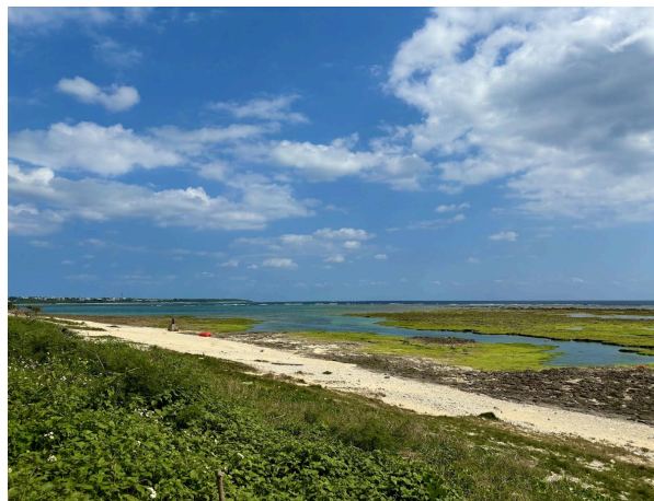
大浜ビーチ 290m (徒歩 4分)