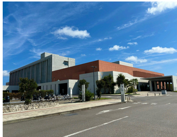
八重山病院 1.7km (車 4分)