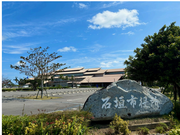
石垣市役所 1km (車 2分)