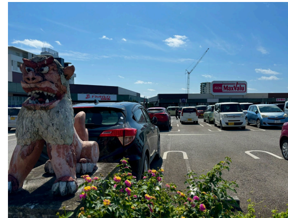
マックスバリュ 400m (徒歩 5分)