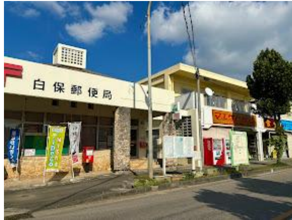
郵便局・マエザト商店 450m 徒歩6分