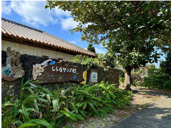
WWFしらほサング村隣り