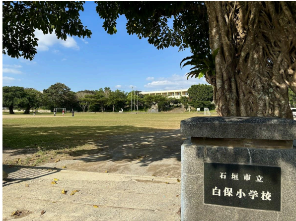
白保小学校 350m 徒歩5分