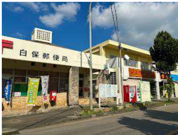
郵便局・マエザト商店 450m 徒歩6分