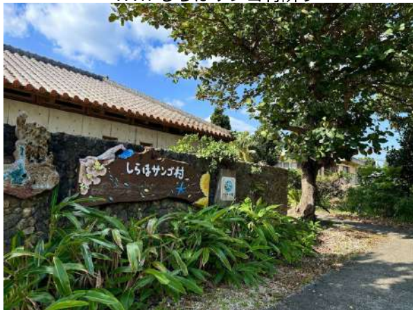
WWFしらほサング村隣り