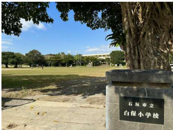
白保小学校 350m 徒歩5分