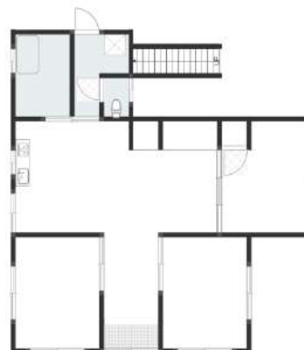
※この図面等は物件情報の一部を抜粋して掲載しております。 ※引渡し日・付帯条件等の変更や、別途料金が発生する場合がございます。