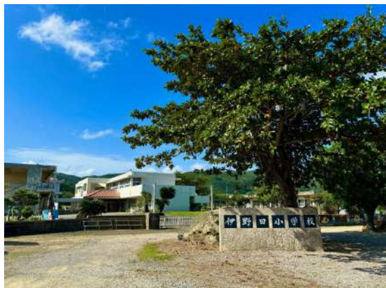
伊野田小学校まで 450m (徒歩 6分)