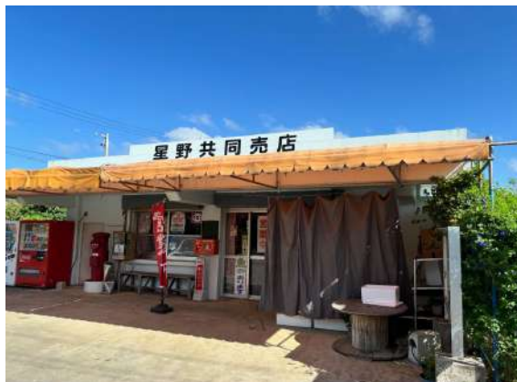
共同売店まで 1.6km (車 3分)