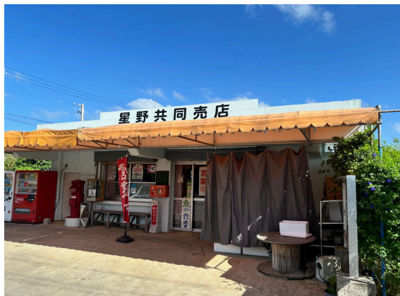
共同売店まで 1.6km (車 3分)