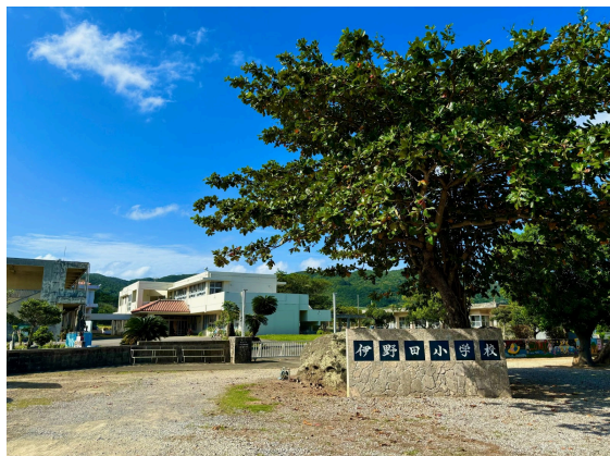
伊野田小学校まで 450m (徒歩 6分)