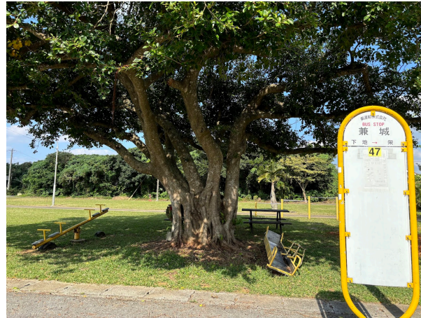
兼城バス停 950m 徒歩12分