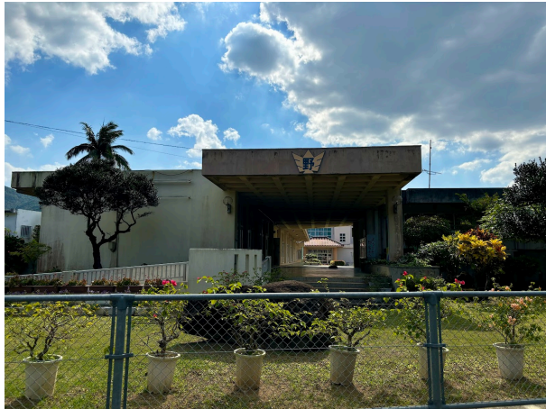
野底小学校まで 1.8km 徒歩 23分