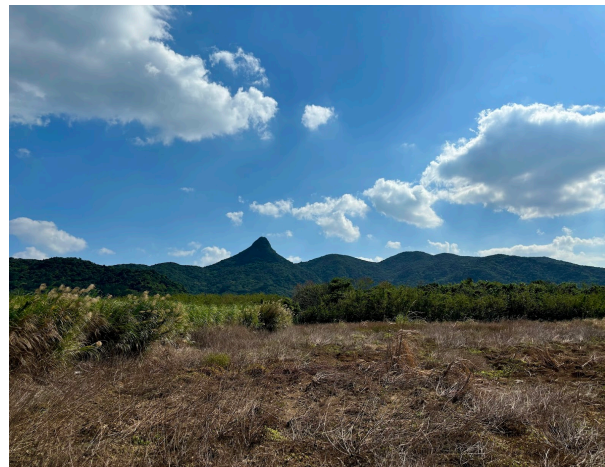
野底岳の登山口 2.2km 車 4分