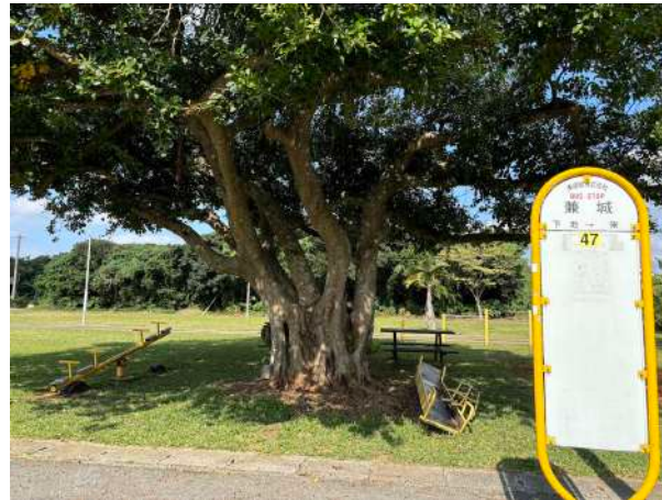
兼城バス停 950m 徒歩12分