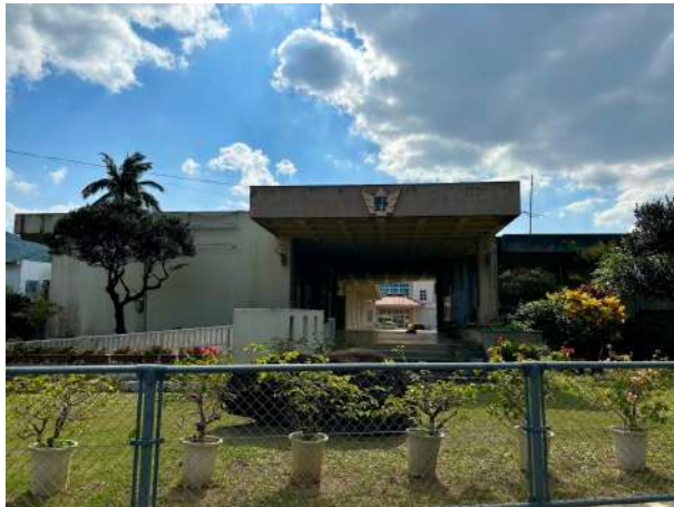
野底小学校まで 1.8km 徒歩 23分