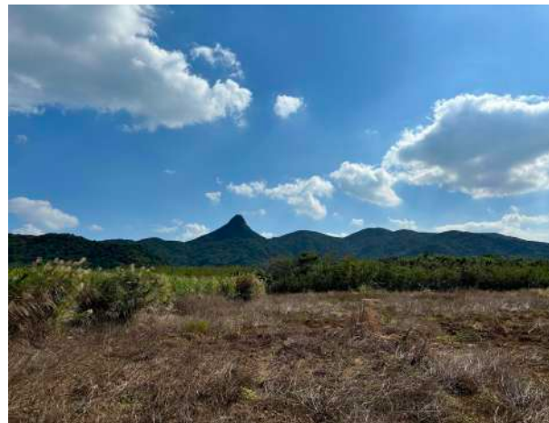
野底岳の登山口 2.2km 車 4分