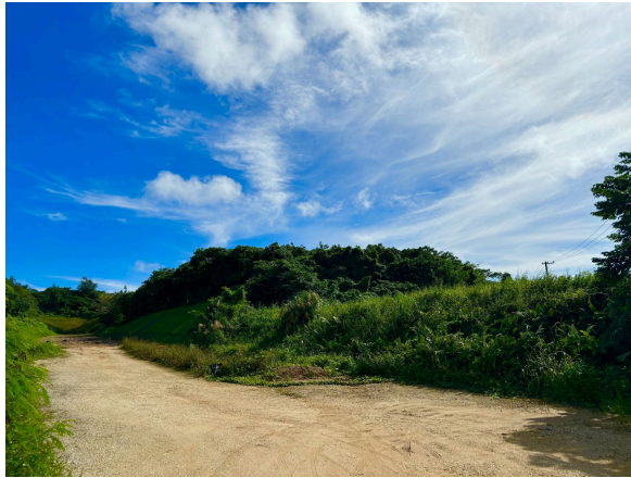
アクセス道路からの進入路