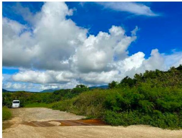
アクセス道路からの進入路