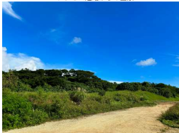
アクセス道路からの全景