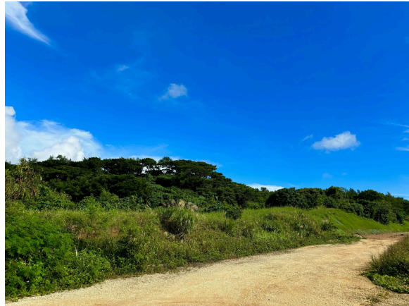
アクセス道路からの全景