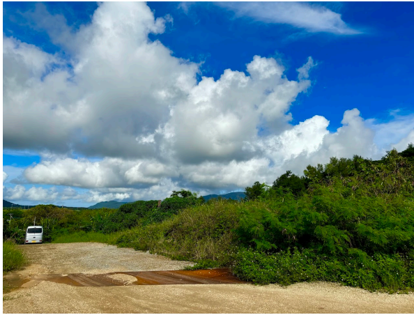
アクセス道路からの進入路