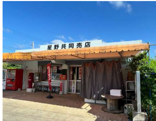
共同売店まで 750m (徒歩 10分)