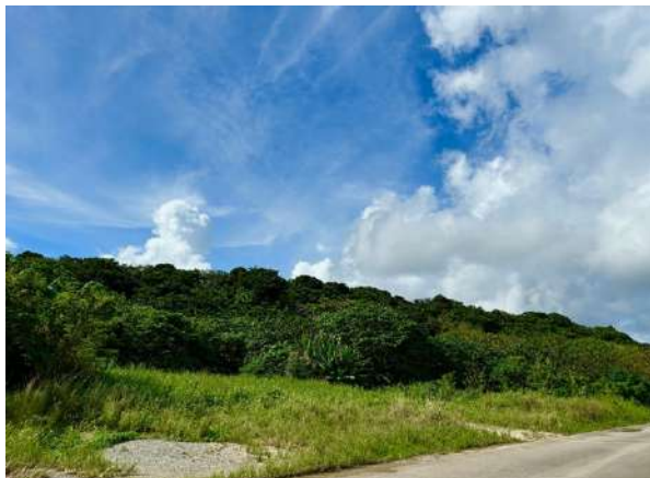
敷地北側公道からの全景