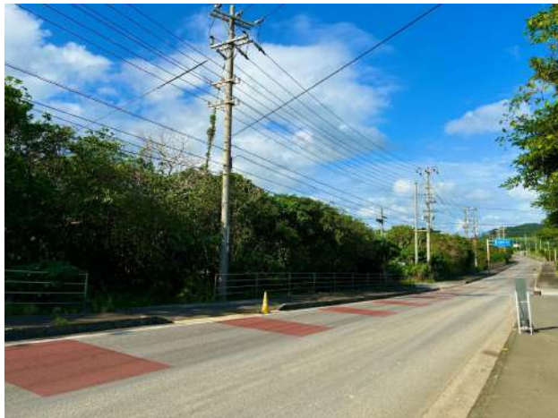
東側公道と公道側の進入路